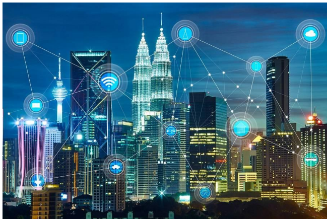
图1 数字城市构想示意图

数字城市，是城市现代化发展衍生出来的一个全新的概念，数字城市以现代化科学技术为基础，侧重城市智能化、信息化、数字化的体现，且包括了数字调查与地图、数字政府、数字企业、数字城市生活四大模块的信息化内容。值得注意的是，数字城市功能的实现，需要数字城市基础地理信息系统数据库的支持。如下图1所示，为数字城市构想示意图：