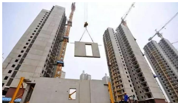
图2 装配式建筑正在进行建造

在设计人员针对装配式建筑进行设计的过程中,必须要针对国家所出台的相关政策进行研究,保证在进行装配式住宅的建造过程中(如图2),一切设计以及建筑流程都是符合国家的相关规定。因此在进行相关的设计过程中,设计师应当紧跟国家的政策进行关于装配式建筑的设计。如,近年来,国家大力倡导绿色环保,因此在进行设计的过程中,设计师就可以在装配式建筑设计的过程中体现出绿色与环保的特色,使装配式住宅能够较高地符合我国的可持续发展计划,并且能够在进行设计与建设的过程中充分地体现出绿色与环保的要点。