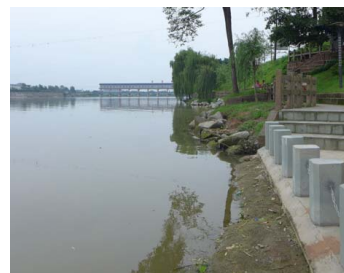
图3 工程水毁修复照片

本水毁修复工程于2014年汛前完工，截至2019年4月，已经抵御了5个水文年度且完好无损，其中2018年相应河段洪峰流量约4100m 3 /s，是河道的造床流量。该工程给笔者以下三点启示：