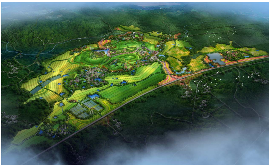
图4-1 衢江区新田铺田园康养综合体鸟瞰图

浙江省衢州市新田铺田园康养综合体主要涉及衢江区浮石街道的元桥村、姜家坞村、方家村、塔石塘村、浮石村等5个行