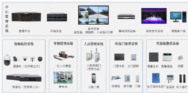
图1 中心管理系统组网示意图

N+1备份模式，确保录像资源的可靠稳定；视频综合平台完成视频解码上墙和图像的拼接控制，同时其在硬件层面支撑管理平台，并通过客户端进行视频切换和控制，通过高清大屏对高清视频进行精彩展现。