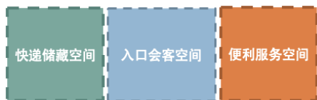
图1 社区入户大堂空间布局

目前我们的很多小区的门卫室在设计时均没有仔细考虑，仅考虑的保安人员的一个座位的使用。实际上，门卫室应当承担更多的功能。比如，快递的接收，临时物品代管，休息等待及便利服务。精心设计的小区入口空间，会让住户更好的感受到品质的提升。这三大功能在小区入口空间的设置基本能解决目前小区内人员的管理问题。设计人员在设计时应结合目前快递柜的大小，便利服务的内容等，对入口空间的尺寸及功能组织进行推敲。