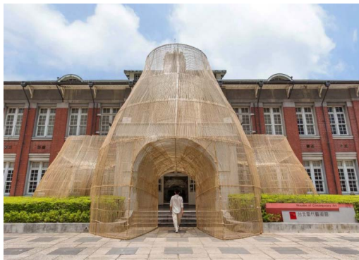
图1 台北筴艺术装置

观“童年的印记”，打破了传统假山雕塑和地面景观之间的界限，运用类似Jura地区地貌的肌理，营造出供人行走、玩耍的景观空间。此外，武汉金地·中法仟佰汇以楚文化凤凰与梭布垭石林为设计灵感，将凤羽元素与色彩、曲线相结合，以简化、抽象形式使灵感造型更具开放性和适应性，在展现当地历史文化内涵的同时，打造灵动、现代的景观设计（如图2）。