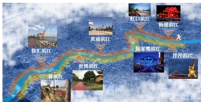
图2 黄浦江滨江两岸区片名分布图

并制定各区片内道路、桥梁、绿地、广场及其他地理实体的命名规则，从专名采词建议到通名使用都进行详细界定，从而有助于塑造和体现不同地域的地名特色景观，进一步强化空间秩序，传递城市历史信息，延续城市文化脉络。