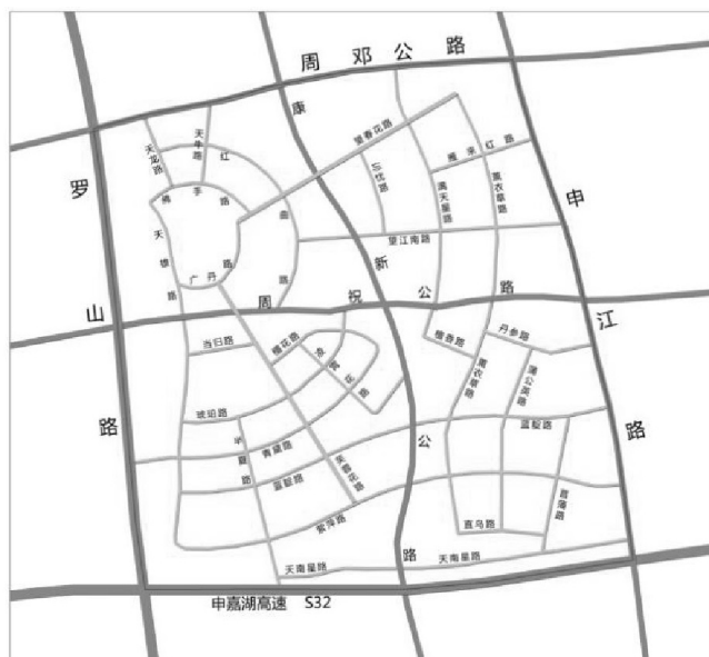
图4 国际医学园区特色路名