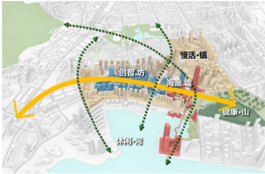
图5 蛇口老镇规划空间结构及与周边功能组团的联系分析图

蛇口老镇在几十年的建设中逐渐形成了一些具有共同历史记忆的标的物。这些历史要素成为片区的特征与名片,需进行保留与传承,如一些传统建筑物、构筑物、老字号的餐饮店面等。更新改造从建筑、象征、精神和风貌等多个角度入手 [8] ,保留片区的城市记忆。