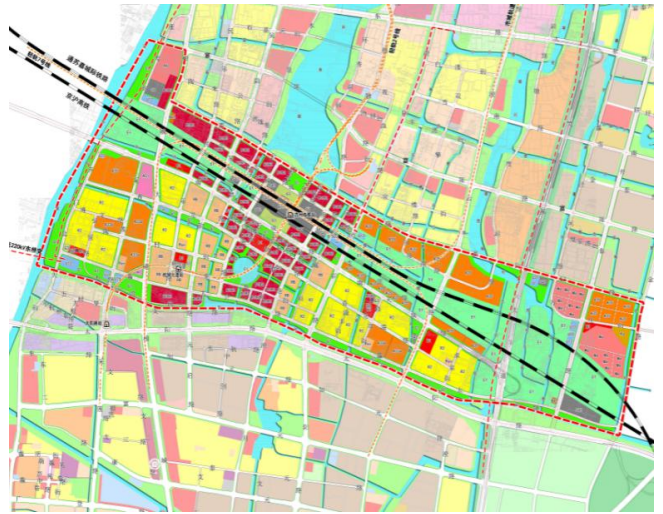
图2 提升用地管理水平

网络技术在诸多行业均发挥着重要作用，若想完善城市规划管理，必须高度重视城市规划管理的信息化和智能化水平（如图3）。计算机系统可存储海量的数据信息，可执行高速运算，丰富城市规划管理的途径，降低人工管理的成本投入。城市规划管理过程中，信息数据是不可或缺的资源，创建完善的信息化管理平台，能够将存储、加工、分析、管理、调取和应用等功能集