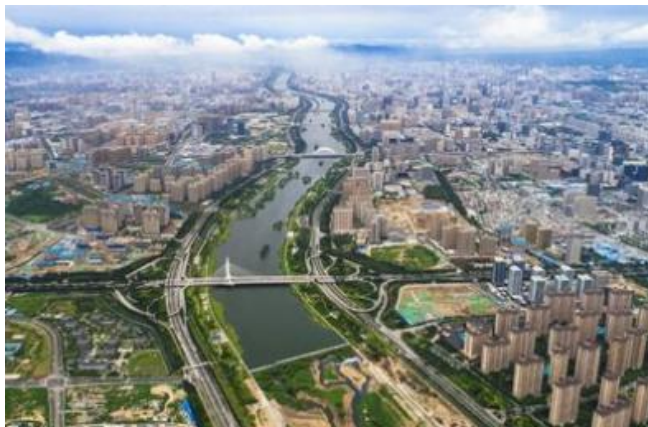
图2 某省国土空间规划蓝图

对于空间规划以及国土空间规划，从表述内容上来看，二者是差不多的，不同在于“国土”二字，侧重说明了后者的主体对象。后者存在着活动与权益等，事实上，并不是所谓的抽象化空间，换句话说讲，后者注重规划工作的进行，执行于实际空间，所以，通过后者来取代前者存在着较大的意义 [1] 。建立并且健全规划体系，能够深入推动空间治理的进行，有效处理空间规划冲突，为更好开展城市规划提供有力指导。图2所示为某省的国土空间规划蓝图。