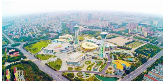
图3 某城市总体规划图

除此之外,因为被较多的因素所影响,比如事权规划,造成规划还有着部分薄弱环节,像:没有充分了解规划体系;对于一些非建设区域,往往不够重视等。为有效处理这些规划问题,应该充分结合国土空间规划,旨在借助总体谋划,达到全方位覆盖城市规划的目标。图3所示为某一城市总体规划图。