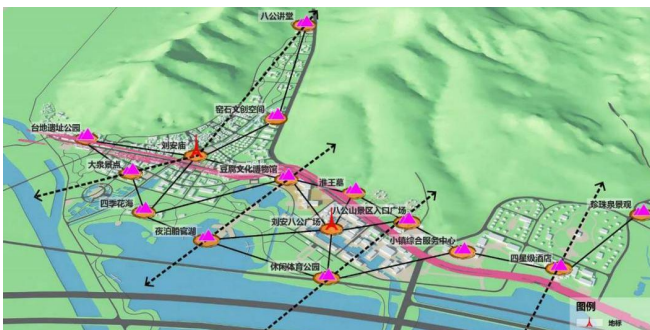
图1 空间景观秩序图

结合城市意向的设计手法，建立了景观视线通廊，如“八公山风景区入口广场—刘安文化广场—船官湖”“刘安陵园—中国豆腐街—五里闸”以及横向的“小镇客厅—刘安雕塑—豆腐文化产业园”等多条景观视线通廊。在视线的中心位置设置了小镇客厅、西汉淮南王刘安墓、刘安雕塑、刘安庙等文化地标（图1）。