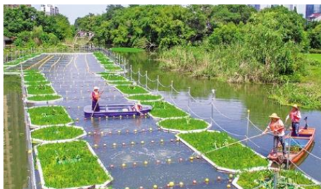
图3 河道建设示意图

结合村庄位置分布，配套相应的排水管道系统，做好雨水以及污水的分流处理，并有效控制地表径流污染。同时，应统一对村内违章架设情况予以排查，并落实地下综合管沟建设工作，配套相应的环卫配套设施，建立相应的垃圾收集站，经科学的垃圾分类，确保环境得到有效保护。针对以往存在的河道问题，相关部门应落实河道斑驳修复工作，并对区域景观进行有效改造。借助专业手段，对河道予以清理，并建设水闸，为日常补水工作提供保障，并促进汛期补水工作开展。同时，考虑到区域用水需求，有关人员应合理拓宽河道，提升河水自净能力，结合区域环境、气候，合理引进树种，增加区域植被多样性，促进区域生态系统的稳定性，进而保障景观质量。图3为河道建设示意图：