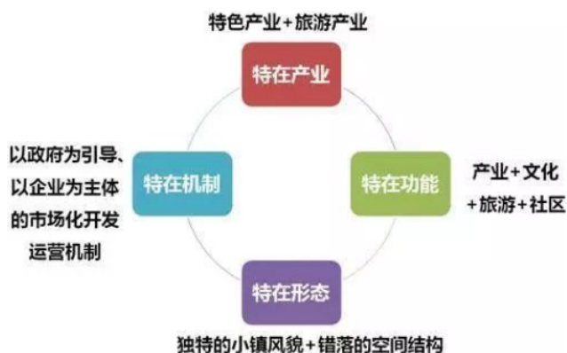
图1 城乡一体化——特色小镇

具有改善建设用地指标的作用。因此，通过总结自身工作经验，积极将当前较为先进的经济组织模式予以引进，能够有效完成田园综合体建设，经三产联动，实现城乡一体化。具体详见图1。同时，考虑到该村历史文化悠久的现状，相关部门应深入挖掘该村文化底蕴，并以此作为参考，完善相应的基础设施建设以及景观建设，有效突出该村的文化氛围，在满足区域旅游业发展的同时，进一步实现对历史的传承与发扬 [2] 。