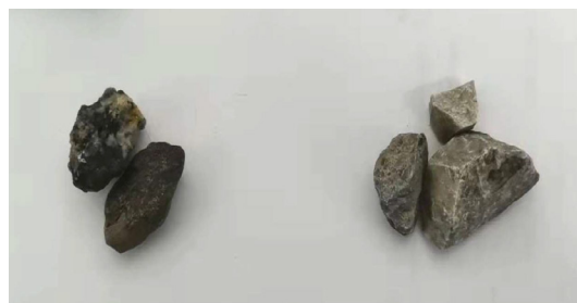
图1 铅锌废弃原矿石图

本课题选用的废弃铅锌矿原矿石由两种矿石组成，图1左侧的颜色较深，为深灰色，见图1，右侧的石子颜色较浅，为浅灰色。其中颜色较深石子占总石子量小于1%，即每袋石子中含有3-5块颜色较深石子，采用X射线衍射分析仪（XRD）对铅锌废弃原矿石的两种矿石进行了分析，分别见图1。