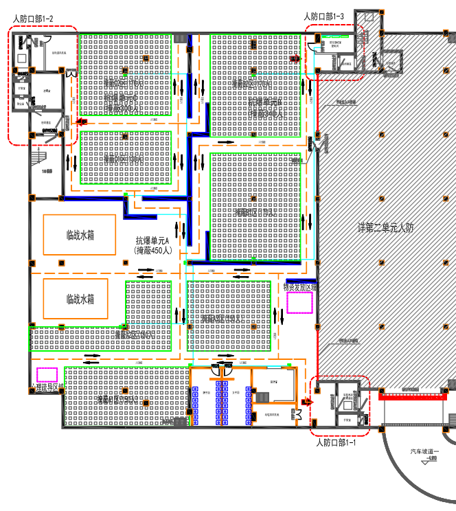
图2 优化后战时平面布置图

传统的三种通风方式切换彼此相对独立，通风阀门为手动阀门，相对笨重，通常数量多达11个阀门，不但手动阀门操作难度大，而且控制方式复杂，在战时严重缺乏专业队员及了解人防专业知识的民众情况下，三种通风方式无法有效快速切换，造成人防工程无法发挥应有的战时效应。