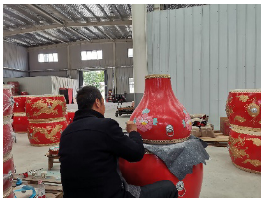
图1 锣鼓制作工艺

村里原有耕地934亩，到2013年底已被政府全征用为建设用地，村民主要经济来源为锣鼓生产经营、建筑业、种养殖业等。全村以锣鼓生产销售加工为主导产业，并有家具厂、汽车用品加工厂。上川口村的锣鼓制作技艺（图1）已成功申请成为陕西省第三批非物质文化遗产，属传统技艺类别，其历史可以追溯到18世纪，始于清代。杨凌现已成为全国同行业的产品门类最全、锣鼓并进发展规模最大、工艺流程、品牌知名度最高的地区，产销量大约占全国市场的30%，成为我国锣鼓产品最大的生产基地。然而，锣鼓产业也存在着一系列的问题阻碍着上川口村的发展：上川口村铜鼓乐器产业从业人员综合素质不高，技师艺人数量较少且面临着后继无人的境遇；生产经营规模较小，效率较低，尚未形与锣鼓产业有关的文化产业链；宣传方式主要依靠于村口广告展示牌与农高会“一村一品”摊位进行宣传展示，传播受众受限 [1] 等。