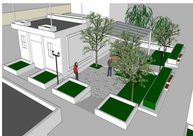
图3 下沉式口袋绿地

同时，为了解决村民反映的排水问题，改造后的口袋绿地为下沉式绿地（图3），能够汇聚雨水进入绿地被土壤吸收，不但一定程度上满足了美观和排水的双重需求，还可以促进雨水调蓄和吸收，减少地表径流，补充地下水。