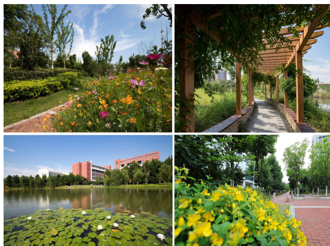
图5 校园绿化建成照片

利用修剪技术，保证植物枝叶处于景观区内生长，而不会蔓延至其他区域。至于秋季植物景观的布置，依据安徽省地域特征与气象条件，于景观园内以果树作为主要的植物，适量种植樱桃树、枇杷树、桃树、石榴树等，果树的生长既能产生美化环境的效果，所结果实又能给学生带来采摘乐趣，其寓意也更加美好。在冬季布置植物景观时，应以抗寒能力较强植物为主，如梅花、含笑花、三角枫、悬铃木等，进而优化校园环境。见（图6）所示。