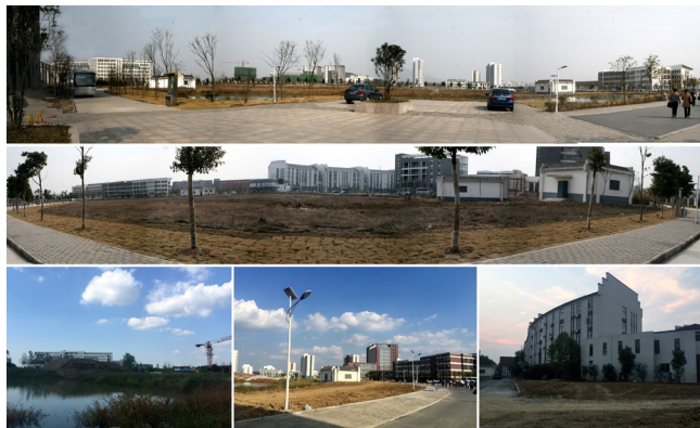
图1 校园改造前照片

校园景观不只是形式与功能的场域设计,作为一个校园文化建设的元素,更是启动学生的理想与行动的根源,地域的文化与历史传承。通过校园的景观设计,体