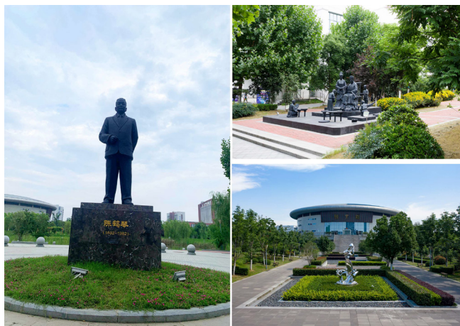
图5 校园雕塑建成照片