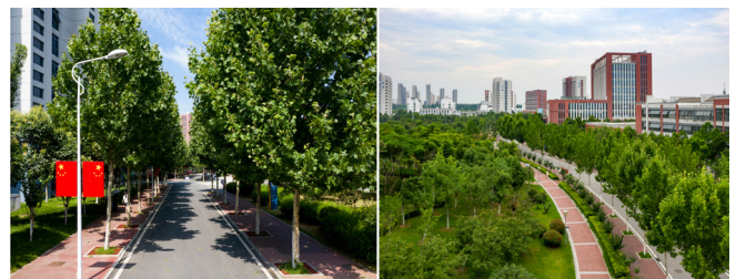
图4 校园绿化道路建成照片

道路作为维持校园内出行秩序的重要结构，除了展现交通职能外，也要融合绿化建设理念。首先，确定好校园交通流量需求，在原有道路旁增设绿道，中间绿化带用樱花和绿篱分隔。为增加道路景观的层次感，在道路两侧绿地内进行地形塑造。使绿化道路在周边环境的渲染下更具绿化特色；见（图4）所示。其次，在竖向设计中渗透海绵城市建设理念，于绿化道路区域内新增下沉绿地，均衡分布的埋设排水管道，快速将雨水转移到雨水管道中，以免路面积水，造成师生出行遇到阻碍。另外，在西入口景观大道上，在林木下埋设排水管道，为绿化道路的顺畅通行给予保障。在道路设计中，搭配对应的草坪以及草坡，也是最为直观展示绿化环境的途径，结合道路分布范围与具体位置，增设休息坐凳、廊架等辅助设施，使设计更加人性化。