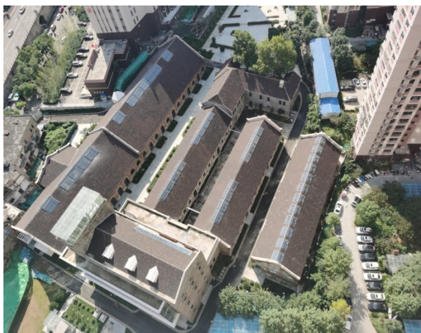
图2 改造后的成丰面粉厂更新为文化主题创意园

根据成丰面粉厂所拥有的独特价值与魅力以及广大市民群众的诉求，2018年济南市政府对成丰面粉厂进行了更新改造和保护性修缮。充分挖掘其深厚的历史文化资源，呈现其历史风貌与时代新貌，把成丰面粉厂打造成为以济南近代工业遗存为依托，在省内乃至国内地标性的文化主题创意园区，既能够唤醒老济南人对这座城市和工业发展的历史记忆，也能够让年轻人因为这里的时尚和前卫向往并融入这里，使这座百年建筑实现“凤凰涅槃”，成为济南新地标和文化景观。