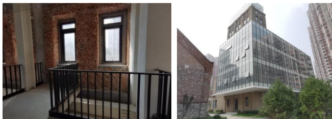
图4 制粉楼新加建观景回廊和玻璃,并保留原建筑红砖墙体,实现传统与现代的有机融合

筑风格与色彩,对建筑进行了原汁原味的修缮。由于经历了百年历史,原粮仓库原来的木结构已经严重腐朽,出现了最大约10cm左右的偏位,墙体的承载力几乎为零。因此对其进行更新改造首先对墙体的基础进行纠偏,植入固定架、注入混凝土,加固保护墙体根基,再通过内外部钢架与保护架,给墙体“正位”。为加强墙体承重力,向墙体内细细地注浆,内部挂网喷浆,让百年建筑更加坚固。