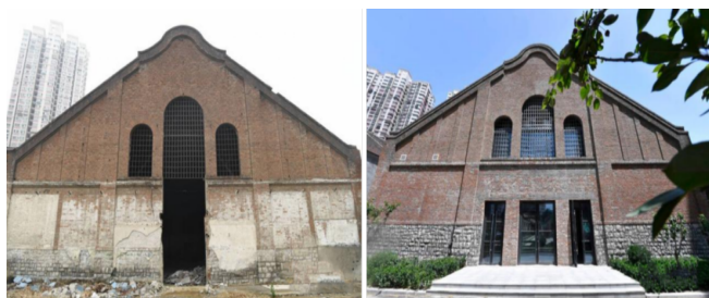
图5 原粮仓库更新前后对比

建筑外立面保留原有巴洛克建筑风格的山墙门面,尽可能使用原始建材对外立面进行修缮填补,清理墙面,精细修缮,修旧如旧,重现建筑原始风貌。对仓库内部年久失修的木梁柱结构裹以钢结构支撑,加固的同时加强防腐、防火功能。仓库更新后,分别成为创展空间、创客空间和综合空间。