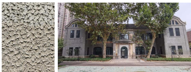
图6 办公楼外墙采用“拉毛”技术,形成鳞片效果,修旧如旧,改造后的办公楼重现巴洛克建筑风格

原汁原味地整体保留修缮原有办公楼,完整保留其内部建筑结构、空间结构。突出修缮保护其巴洛克的建筑风格,保留原券形门洞、窗洞造型,更换现代断桥铝中空玻璃门窗,对原有立面造型、砖石墙体进行了修旧如旧地修补、粉刷和复原。原办公楼外墙有着看似鳞片一样的非常有特色的立面装饰。外墙修复采用“拉毛”技艺,由修复人员用水泥加胶进行调配,使用平板,趁