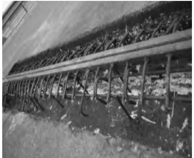
图2 公路桥梁伸缩缝钢筋设置

项目部对施工现场进行严格勘查之后对原设计图纸从以下几个方面进行优化：首先，在原图纸设计中设置了10cm的承台伸缩缝。但经过勘查发现如果按原设计进行，在公路投产后会出现搭板不均匀沉降问题，由此很可能会引发混凝土开裂。其次，桥台背墙伸缩并未设置钢筋进行锚固。针对上述两个问题项目部采取40cmU型钢筋作为背墙伸缩锚固，利用钻孔方式将其下入混凝土中，钻孔直径和深度分别为20mm、16cm。详见下图2。