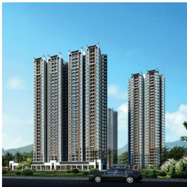
图1 石丰路保障性住房建筑产业化项目

装配率达到52%，A户型装配率为15.21%，B户型装配率为34.24%。如下图1：为石丰路保障性住房建筑产业化项目示意图。