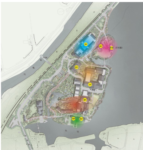
图3：总体功能分区图

设计改造后将酒店分为5个功能区块：1#楼、2#楼组成的核心客房区；新建8#楼作为国宾政务接待区；3#楼的会议宴会区；位于半岛区域的6#楼及亦方壶茶楼组成独立的高端接待区；以及坐落于酒店南侧湖岸边的9#楼、10#楼组成的特色餐饮区（图3）。改变了酒店总体布局较为凌乱、功能分区不够明确的现状。