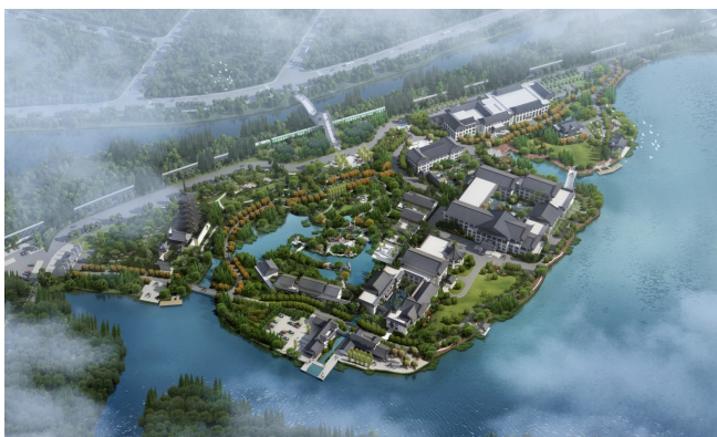
图8：改造后整体鸟瞰图

经过设计一系列有效的改造举措，从总体到建筑，从景观到室内，设计将南湖国际国际俱乐部酒店进行了全面提升改造，保留嘉兴南湖的历史文脉，强化了酒店整体的场所感，亭台楼阁、长廊假山、水榭花台，重建江南水乡的新画卷，为客人打造具有中国风情的世界级体验空间，与南湖的自然景观相合相生，使酒店呈现出湖光珑璁、嘉禾名园的独特胜景（图8）。