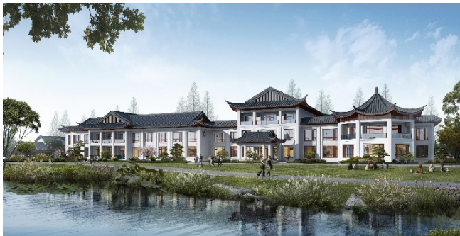
图2：8号楼沿湖效果图

因目前酒店功能仅能满足日常经营，缺少满足政务接待及高端商务需求的客房及配套功能空间。园区内8#楼建设年代久远，结构形式为砖混预制板结构。但位置绝佳，面向湖心岛方向一字展开，视野开阔。是配建高端客房区的极佳选择（图2）。因为设计考虑落架重建8#楼，配套会见厅、会议室、行政酒廊及高端客房，以满足政务接待需求。