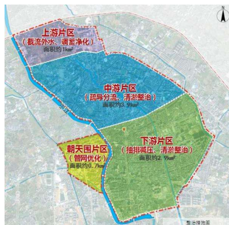
图3 雨水工程改造方案

(2) 中游片区。沿兴田一路和团结路各建设一条箱涵，雨天时，将东排沟内的水分流排至宁江，减轻下游压力，加快家炳中学区域的排涝速度，重划排水分