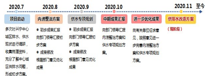
图2 老城区给排水系统升级改造方案设计思路

本项目给排水系统方案设计时应以近期需求为主，并结合远期规划，完成其升级改造的两步走（一是解决城区内涝严重的问题；二是解决合流制带来水体污染的问题），实现内涝防治科学高效，保障排污整治经济环保，其具体思路见图2。