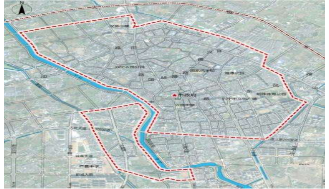
图1 某市老城区给排水系统升级改造范围

造作为区域“十四五”建设重点工作，计划对河西侧的朝天围片区和河东侧、人民大道（G205国道）以北的市中心老城区给排水系统进行集中整治，如图1所示。