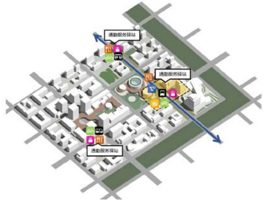
附图：信创理想城通勤服务驿站布局示意

通勤服务驿站空间布置原则：交通节点——5min服务圈对应服务半径，结合地铁出入口下沉广场空间，引入通勤服务商业功能，设置便利商街或灵活售卖点，为新创人员提供便利的生活配套。