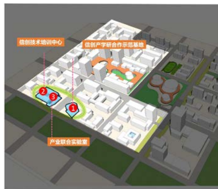
附图：信创理想城新型研发平台布局示意

空间布置原则：围绕研发企业布局，5min服务圈对应服务半径。新型研发平台靠近城市绿地布置，以高品质的环境推动企业发展创新，新型研发平台靠近城市绿地布置，以高品质的环境吸引研发创新企业集聚新。位于研发组团核心区域，可集中设置于独立空间，也可布置于首层开敞空间内。