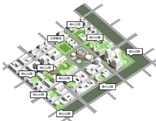
附图：信创理想城街心互动公园布局示意

街心互动公园空间布置原则：组团节点——5min服务圈对应服务半径，位于产业节点，产业园区街心公园，让信创人员在工作之余，能够散散步，聊聊天，为信创人员的健康加分。