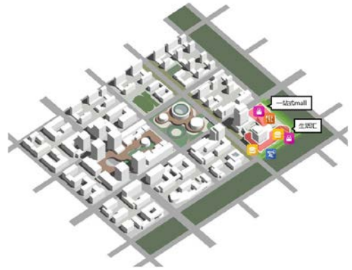
附图：信创理想城一站式生活汇布局示意

一站式生活汇空间布置原则：生活核心——15min服务圈对应服务半径，沿经城市绿谷或集中绿地区域，结合慢行步道和广场设置大型商业mall，激活街区人气，打造信创快节奏下的都市慢生活。