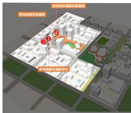
附图：信创理想城攻关适配平台布局示意

空间布置原则：围绕骨干企业布局，10min服务圈对应服务半径。适配攻关平台采用大跨度、大空间的建筑形式，兼顾灵活性与适用性。适配攻关平台采用大跨度、大空间的建筑形式，兼顾灵活性与适用性。可集中布置于企业临近的独立开敞空间或裙房空间。