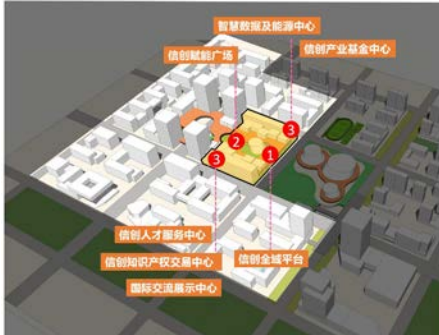
附图：信创理想城综合服务平台布局示意

空间布置原则：靠近园区中心，服务全域产业 15-10min服务圈对应服务半径。灵活的建筑形式与明确的功能布置，为全域提供高效而便捷的综合性服务。全域平台和赋能广场位于园区核心位置，“多中心”可围绕赋能广场，以独立小体量相邻布置，也可集中整合设置于同一大体量公共建筑。