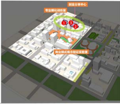
附图：信创理想城孵化赋能平台布局示意