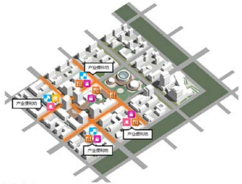
附图：信创理想城产业便利坊布局示意

产业便利坊空间布置原则：产业节点——5min服务圈对应服务半径，结合产业特色平台组团，设置舒适贴心的健身、托幼和便利餐饮等场所，位于办公建筑的裙房层或集中独立设置。