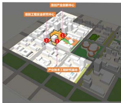
附图：信创理想城产业创新平台布局示意

空间布置原则：围绕龙头企业布局，15-10min服务圈对应服务半径。产业创新平台与龙头企业在垂直方向叠合布置，最大限度上提升两者的联系度，激发产业创新能力。建议产业创新平台与龙头企业就近集约布置，最大限度上提升两者的联系度，激发产业创新能力。可布置于企业临近的独立开敞空间或裙房空间。产业技术工程研究基地也可考虑结合不同企业布置于办公建筑标准层。