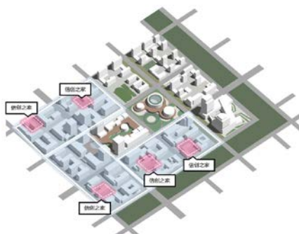
附图：信创理想城信创之家布局示意

信创之家空间布置原则：产业节点——5min服务圈对应服务半径，结合产业特色平台组团，丰富信创人员工作间隙的文艺、党建活动。位于办公建筑的裙房层或屋顶层设置。