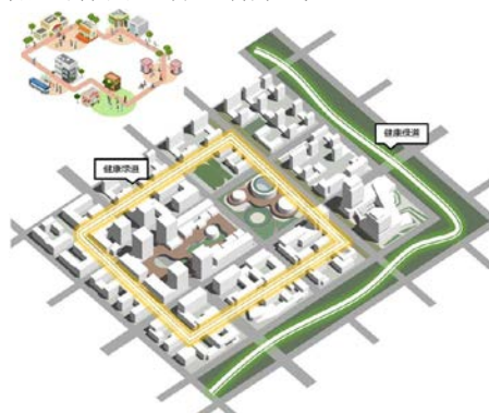
附图：信创理想城健康绿道布局示意

健康绿道空间布置原则：5min服务圈对应服务半径，位于生活区临城市绿谷的滨水绿道，为信创人员提供亲近自然的休闲运动生活方式。