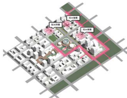
附图：信创理想城周末雅集布局示意

周末雅集空间布置原则：社区节点——5min服务圈对应服务半径，位于社区节点，满足周末节假日，与家人朋友共度闲暇时光的生活需求，开展丰富的茶艺、手工等活动。可布置于生活组团底层沿街空间。