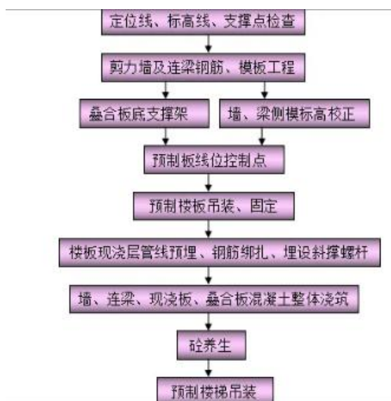
图1 叠合板施工流程

起吊点的选择需要结合图纸情况，并再次检查构件尺寸是否与图纸要求相一致。此外要检查预留出的管线洞口的位置精准度，并根据构建情况选择起吊工具，通常情况下会使用加钢梁平衡吊具。如图2所示，分别为4米以上的板吊装以及小于4米的板吊装。