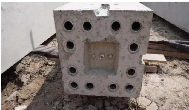
图3 套筒预埋定位钢板固定

第一，柱与柱的连接。在具体工作中，要求技术人员运用“定位钢板”的形式固定钢筋，并将其与预制柱的位置相对应。在完成混凝土浇筑之后需要完成预制柱的吊装，并将下面的钢筋区域插入预制柱灌浆区域的套筒内部。此种形式可以达到良好的连接效果。如图3所示。