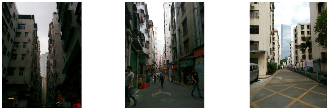
图1 深圳岗厦村现状