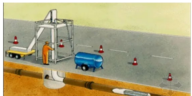
图2: 非开挖胀插法施工工艺

的基础上，能够实现以相邻两座检查井作为实际操作空间的方式对市政排水管道进行改造，而管间错口通常不会超过2cm，在管道改造中有助于更好地减少工程投资以及避免破坏周边附属物的目的。