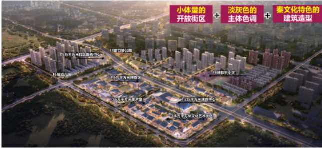
图4 开发单元建设效果示意图

(1) 在建设高度和风貌方面，落实阿房宫遗址建控区管控要求。按照阿房宫遗址保护规划，落实两级建控高度要求，一类建设控制地带内建筑高度不得超过8米，二类建设控制地带内建筑高度不得超过18米。同步协调外围与建控区建设高度，避免相邻高差过大，避免“高低配”情况，相邻建筑高度差应不大于30米，形成逐渐变化的高度界面。延续阿房宫特色风貌形象，公共功能以小体量、淡灰色、连廊贯通的开放街区空间为主，凸显大气简约、舒展整齐的建设风格。