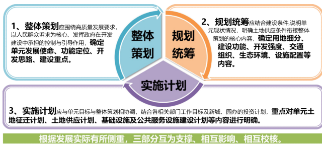
图1 开发单元主要编制内容

内容要求。以控制性详细规划管理单元确定的强制性控制内容为指导，通过梳理现状、统筹资源、协调利益，制定单元近期开发建设目标，并从整体策划、规划统筹、实施计划等做出全面的、综合的实施安排。