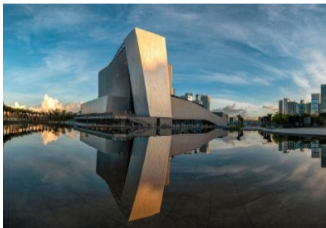
图5 演艺中心实景图