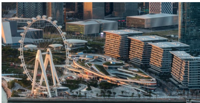
图2 绿色生态设计示意图

2. 营造特色办公空间。为应对当前办公销售日渐冷淡的市场环境，欢乐港湾项目首创总裁办公理念，领跑高端的办公市场。同时在设计过程中，最大化地利用海景资源，在南侧的海景办公区建筑设计中采用退台的形式，并结合建筑体型的变化设计生态立体绿化平台，将公园与乐园立体景观相互结合。此外，增加垂直绿化设计，在北侧的生态办公区核心筒位置外设立立体绿化景观墙、整体高为50米，成了立体绿化的代表作。下图3所示即为垂直绿化示意图。