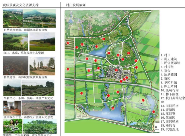
图2 小芦山村现状资源与发展策划

根据小芦山村的规划定位,结合空间发展策划和场地条件,将小芦山村生活空间划分成一轴、四巷、五片、多点的景观结构。除此之外,依据小芦山村传统建筑特征,对建筑样式做出具体设计引导。