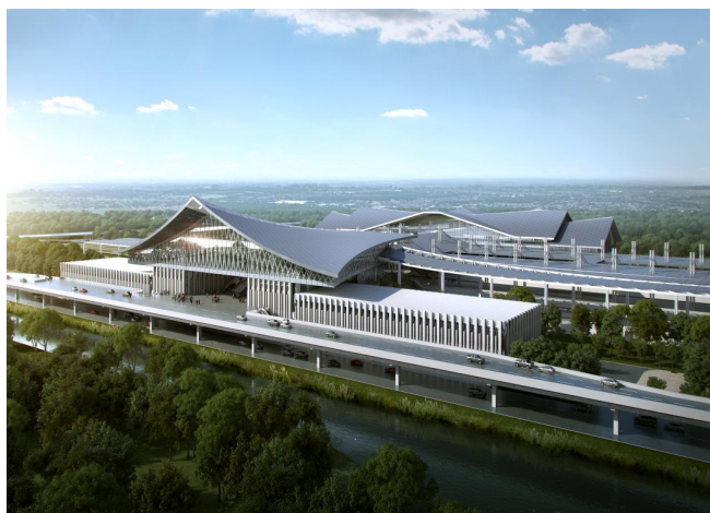
图5 温州南站效果图

现场情况复杂，城际、城市轨道交通接驳，老站、新站需要有机融合，同时，河流、道路使得原本复杂的环境更加需要全面系统的考量（见图5）。