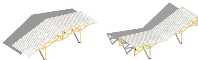
图4 永嘉站标准的屋面单元

折板的屋面系统为太阳能的利用提供了基础，建筑能合理利用自然天光，减少建筑照明负荷。侧面高窗的设计，可以充分利用自然通风，降低建筑能耗。项目建成将为中国铁路站点建设提供一个全新的节能示范（见图4）。