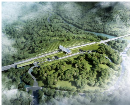
图1 楠溪江站效果图

楠溪江站位于楠溪江中游东岸，周边山峦起伏，风景如画。计划建设车场规模为2台4线，侧式站台2座。车站选址于双驼山上，从山中穿过，为站房的设计提供了绝佳的山水环境。站房主体建筑面积控制在1万平米以内，采用下进下出的组织方式（见图1）。