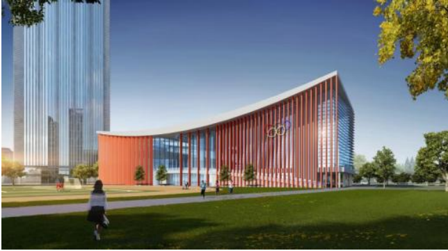
图2: 本工程的基本情况

我项目通过以上方案完成主体结构的施工，一是节省了工期，提高了施工效率；二是降低了成本，将大型机械设备进场后的时间充分利用，避免大型机械设备的闲置；三是降低了安全隐患，减少了高空作业和交叉作业可能出现的安全问题。本工程的基本情况，如图2所示的相应内容。