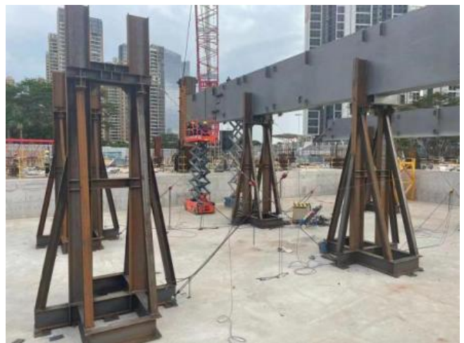
图3: 本工程支座情况

在钢结构基本拼装完成后，需要实现钢结构的吊装，促使钢结构屋盖施工技术得以合理的实施。具体