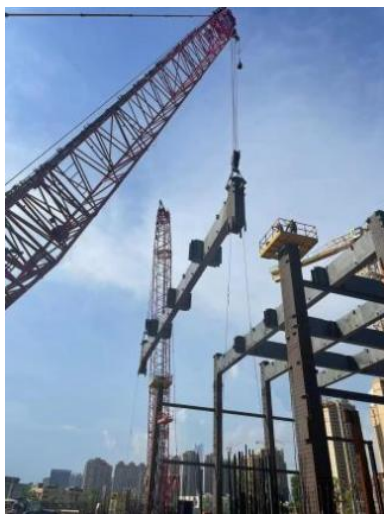
图4：本工程吊装的相应情况

由于体育馆的轴线柱标高有差异，中间混凝土柱最高，两端最低。支座安装前，需要对各柱顶板的实际标高，再测设钢支座的轴线位置，测试之后，对的“+”定位线，进行研究并对支座吊装到位后，用仪器测量支座安装的位置，微调到的设计坐标高的位置。在成品支座安装的过程中，需要严格对误差进行控制，降低误差的不良影响，从而使得支座的安装水平得以保证。如图4所示。