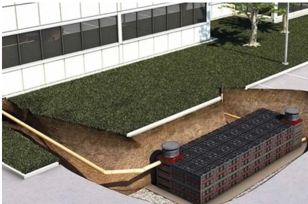
图四 蓄水模块效果图