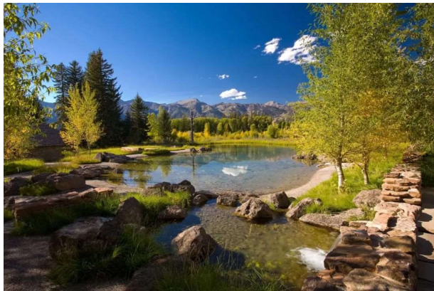
图六 雨水蓄渗塘实景图

第三，雨水蓄渗塘。蓄渗塘是同时具备蓄水和渗水功能的雨水池。通过建设科学完善的雨水蓄渗塘，可以在根本上利用雨水收集池和蓄渗塘的价值效用，在雨水排放过程中展开合理性渗滤及调蓄处理，充分满足城市道路排水、蓄水及治理功能的高度结合基本目标。