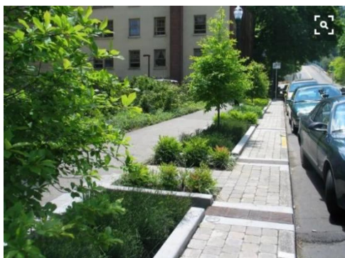
图二 道路汇水实景

在保障道路车辆稳定性、安全性过程中，道路建设的整体质量控制工作也是不可忽视的，主要体现在构造健康、舒适、安全的行车环境。一般情况下，长时间车辆荷载作用往往会对城市道路带来不必要的负面影响，因此在筛选路面材料阶段中需要重点参考透水性能良好的材料。传统路面设计通常以路面坡度为基础对积水加以引导和控制，整体路面排水效果不够理想。然而在海绵城市理念的应用背景下，相关设计团队需要对原有的道路设计理念加以改革创新，除了优先筛选透水路面铺装材料以外，还需要及时构建出空隙大、透水性强的结构层，以此来保障在阴雨天气下可以促使路面高效渗透，所构建的结构层也可以凸显出过滤渗透水的功能价值。比如运用碎石铺装及透水沥青混凝土材料铺装等措施方法优化道路主体路面的排水效果，促使其及时排除道路结构层内部所储存的积水 [2] 。