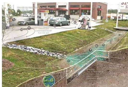
图三 绿化带滞水系统示意图

在海绵型城市给排水系统构建阶段中，下凹绿化带凸显出一定的价值地位，其所具备的价值优势体现在对水体资源加以收集、过滤、储备和排放等等。首先，在出现降雨天气后，雨水会按照地表径流方向逐步流入绿化带位置，最后统一聚集于溢流雨水口位置。为了提升整体排水工程质量，相关工作人员需要结合实际情况科学掌控其整体高度，一般情况下需要保障绿化带设置