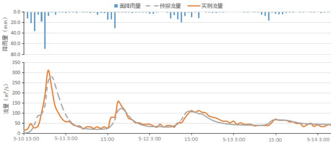
图1 梅州水库2022年“5.10-14”场次洪水过程线

在2022年“6.13-15”场次洪水中，梅州水库发生短时强降雨，暴雨中心在库区附近，流域面平均降雨量250mm（最大小时雨强为6月14日8时的148.5mm），入库洪量1619万m 3 ，库水位涨幅3.85m，径流系数为0.487。其中，系统预报洪峰流量433.97m 3 /s，峰现时间为2022年6月14日10时；实测洪峰流量384.32m 3 /s，实际峰现时间为2022年6月14日10时。降雨及洪水预报模拟过程，见下图2。