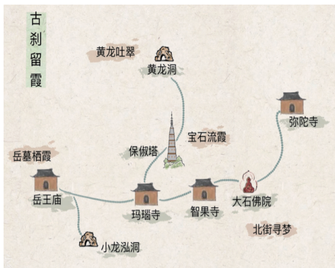
图4：路线规划图③（作者自绘）

路线③：西湖北岸：宝石山-葛岭一带：该路线以古刹留霞为主题，包括宝石流霞、岳墓栖霞在内，借景雷峰夕照。此外，登临宝石山，可俯瞰西湖全景，古刹、晚霞，浸润心灵，湖光山色亦尽收眼底。