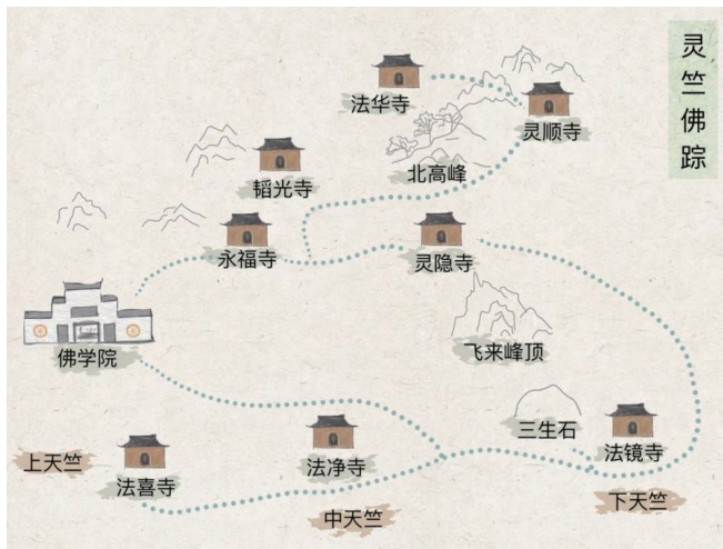
图2: 路线规划图①(作者自绘)

路线①：城西：灵隐-三天竺一带：该线以灵竺佛踪为主题，深山藏古寺，“佛”的踪迹需要寻觅，各寺庙及佛学院的佛学讲堂是此线的特色之一，又因此处靠近龙井，周边广布茶园，是最能感受到禅茶文化的旅游路线，网红景点法喜寺吸引了众多游客。