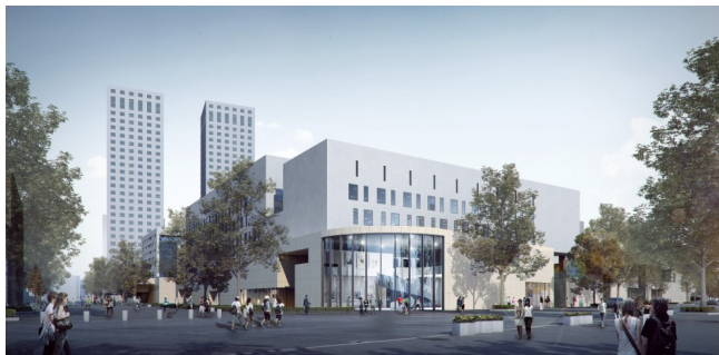
图4 城市街景效果图

作为八大美术院校之一的天津美院拥有5000人的学生规模，其南北校区之间的联系紧密，建议将天纬路天津美院段改为步行街，一来可顺应南北校区之间的联系，使得天纬路更加安全、适宜，二来与天纬路大悲禅院段呼应形成整体步行街。