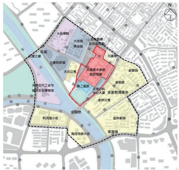
图1 基地周边现状图

规划研究范围为西至五马路、北至元纬路、南至狮子林大街、东至金海道，总占地面积89公顷。规划设计范围包括现状校区和扩建区，其四至边界为：东至中山路、南至海河东路、北至学生宿舍北边界、西至三马路，总占地面积11.3公顷。规划设计范围包括天津美术学院现状校区（由南、北两院以及北院北侧的学生宿舍区构成）、天津市第二医院、金钢公园、天津万科中心大厦及其附属用房、少量住宅和商铺。规划建设可用地范围是以规划设计范围为基础，不包括市政道路和绿化用地、金钢公园以及万科中心大厦附属用房地。总占地面积6.4公顷。