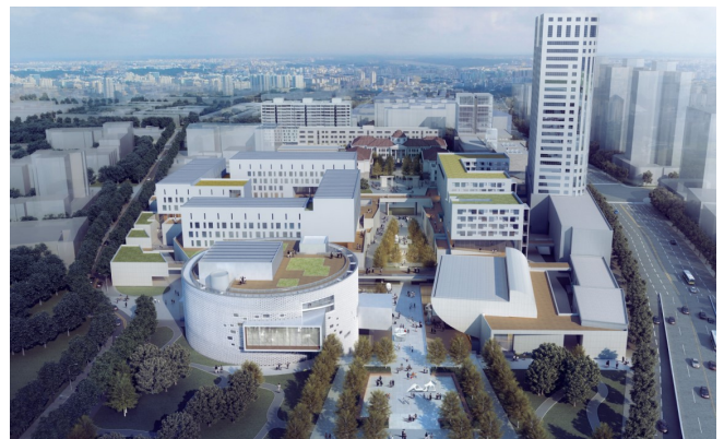
图7 校园内街效果图

如果把北校区主体建筑定义为古典主义，北校区校门定义为新古典主义，那么南校区则是典雅主义风格。南校区新建建筑外墙采用清水混凝土，材料的质感和纯净感能够很好的突出建筑的体量关系，且其色彩与研究范围的色彩有机融合，成为尊重城市的整体。作为海河风景线的新建美术馆与大礼堂采用较为纯粹有力的几何体，像美院的素描石膏体一样在海河滨岸昭示着美院的兴盛和传承。