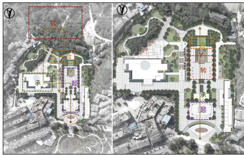
图4 空间序列表达示意图

通过将文化、主题、景观有机的融合,整个园区形成起——承——转——合的总格局。主广场区域也结合植物、景墙、景观小品的组合,营造起——承——转——合的空间序列,(如图4)。详细的景观设计途径在此不做详述,最终通过项目的实践,实现了文化挖掘凝练主题定位,主题定位指导景观设计,景观设计呈现主题定位,承载和延续文化,三者相互促进,正向“纠缠”,营造出文化沁染、寓教于乐的环境空间,升华了息烽集中营革命历史纪念馆发挥出的政治意义、历史价值、教育功能和社会效益。