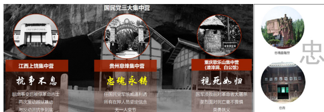
图2 文化挖掘示意图

在景观改造设计中，通过紧扣息烽集中营“忠”的精神内核开展，从室外景观展示，景观体验，到室内文化陈列等，全方位体验感知精神文化内核。（如图2）。