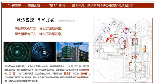
图3 景观构图示意图

以“烽火不息 星火相传”为理念指导改造设计,这是一次“冲破牢笼——忠魂永铸——星火相传——烽火不息”的历史与今天及未来的传承与对话。集中营——人间的炼狱,革命志士在烈火中永生,化作闪耀的星光,这就是“忠”魂,是坚定的革命信念,需要认知过去,将红色精神永远相传。因此景观的设计从烽火不息到星火相传,以“星”“火”为构成元素,以线条表达传扬,以圈层表达“信念场”和红色“精神波”。打造寓教于景的纪念广场景观。结合展厅的建筑立面及广场的空间秩序提取冲破牢笼的元素,将之运用到构图及铺装的设计中。“烈焰忠魂 生生不息——炼狱怒火破牢笼,赤胆忠诚现英雄。星火相承传千古,烽火不息耀苍穹。”将贯彻到总体构图与要素布局中。(如图3)。