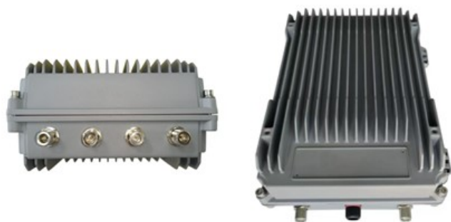
边缘计算网关（室外融合型）

作业人员佩戴1台防爆移动作业监控终端（无线自组网传输）和1台便携式气体检测仪，监护人手持1台防爆移动作业监控终端（无线自组网传输和4G传输），可