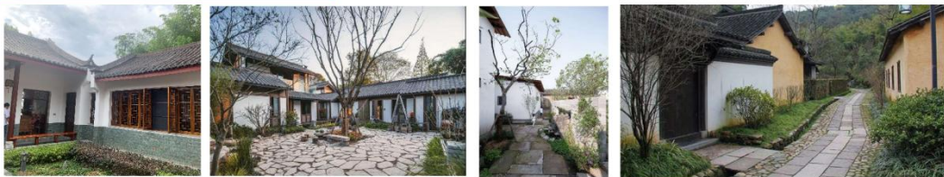
宁远县下寨岗村人居环境整治

了传统的以城市为中心的城市管理体制的转变。国家对村级组织实行了全面改革,村级组织的职能由传统的以人为本的管理向以人为本的管理转变。在永州市宁远县政府中,要充分发挥地方党政领导干部和其他领导干部的作用,切实做好党的自身建设。我们应该明确以社区为主体,以政府为主导的中介组织在构建和谐社区治理中的作用。