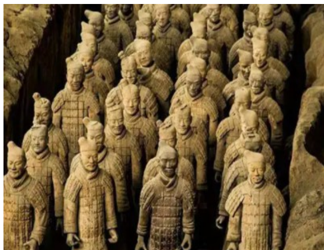
图1 兵马俑（世界文化遗产、全国重点文物保护单位）

识别历史文化价值是城乡建设中历史文化保护传承的重点内容。我国很多城市具有特色鲜明的历史文化价值，彰显了我国不同地区不同群体的精神文化和民俗传统，通过识别历史文化价值，并将价值理念融入城乡建设之中，可以为文化的传承保护提供全方位的理论支持。习总书记强调文化自信对于民族发展的影响，历史文化传承体系建设应以价值为导向彰显文化自信，推出民族符号和文化形象。例如，西安城市具有悠久的历史，是我国古代重要的政治经济文化中心，有着很多珍贵的历史文化资源，包括半坡、杨官寨等。同时古代的西安是中华民族对外交流中心，在多种文明的交汇中形成了独特的历史文化集群。周、秦、汉、唐等朝代的都城选址均位于西安地区，在建都营城、科学艺术方面均具有宝贵的历史文化价值。新时期的城乡建设必然会对原有的历史文化遗存造成破坏，经过长期的历史变迁，部分历史遗迹已无原始风貌，无法彰显出其原有的历史文化价值。新时期的城乡建设在体系规划上，应注重考量历史文化要素，切实做好历史文化价值的识别工作，避免城乡建设过程中破坏原有的历史文化遗产 [3] 。