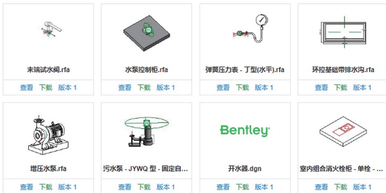
图1 道路集水设施族库

为提升城市排水系统建设效率,BIM平台之中也需要对各类模型进行拆解整合,构建专项的排水系统设备设施族库。例如,在某市政道路集水设施建设项目之中,工程单位对集水设施族库中的阀门、管道、水泵等进行了优化改进,形成了如图1所示的设施族库,能够为BIM平台三维模型的快速建立提供有力支持。在平台建设发展过程中,建设单位也需要积极推进族库模型的流通共享,为不同项目提供多样化的模型选择,实现城