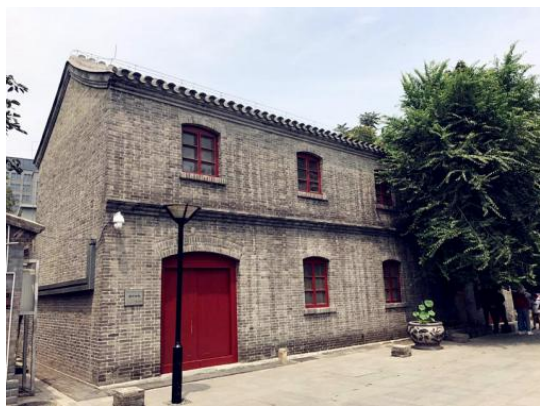
图1 临汾会馆外立面

北京临汾会馆分为西馆和东馆，西馆位于前门外廊房三条，东馆即为此地，又称临汾乡祠，是由山西临汾旅京的纸本、颜料、干果、烟行、杂货五行商人共同集资兴建的，其主要用途是服务于上述各行的商业活动，同时兼有祭神、演剧、联谊等多种功能。该馆始建于明代，清乾隆三十一年重修，重修碑记，现仍保存于该馆。清光绪三十二年（1906年），北京商务总会成立，各行商贾纷纷组成各行业商会，临汾乡祠遂废而不用，沦为居民住宅。临汾会馆（东馆）建筑在2015年由东城区委、区政府保护修缮，天街集团将其改建为展示和传承北京会馆文化的北京会馆文化展览馆（见图1）。但展示方式大多数为陈列式展示，无法让用户沉浸式感受临汾会馆文化底蕴，缺少文化价值与特色价值并且新建建筑与原始建筑融合过于生硬，无法体现新旧共处的关系，丢失历史价值（见图2）。在商业上没有完整的商业模式，缺少商业价值。