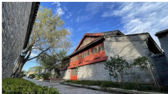
图3 颜料会馆外立面

颜料会馆位于东城区前门街区青云胡同22号，又名平遥会馆，始建于明代中晚期，初名平遥会馆，是北京地区颜料商、桐油商的供奉之所，是京城较早兴建的商办会馆之一，其“前寺后殿”格局为明清时期常见的会馆建筑形制。2021年7月起，东城区对颜料会馆（见图3）等一批会馆旧址进行文物活化利用，陆续推出“会馆有戏”文化演出项目。去年至今，“会馆有戏”在颜料会馆保持每周一场的演出频率，以民乐为主，通过相声、鼓曲、杂技等多种艺术形式展现，但没有地域特色，缺乏特色价值，在平时以餐饮服务为主（见图4），与会馆主题逐渐脱离关系，失去了应有的文化价值，展示区域与会馆文化毫无关系，体现不出其历史价值，所有模式都只是一味追求商业价值最高的形式。