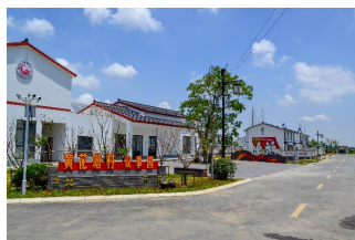
公建旁公共活动空间

我们在深挖黄花塘的红色文化历史,通过艺术手段将特色文化景观化,延续纪念馆的红色文化氛围的同时,也深入调研社区居民的生活习惯,增添一些人性化的场所,满足功能需求。如在调研中项目组明显发现社区中缺少公共活动空间,公建旁仅有一处宣传栏和设置在草地上的健身设施,为满足村民活动需求,营造真正“有用、好用”的活动空间,我们根据现状情况和村民意愿,最终选择利用公建旁保留下来的乌桕树,打造黄花塘村议事园,并利用文化展示墙和主题雕塑进行文化展示,再现新四军军部驻扎黄花塘期间情景,展现“村