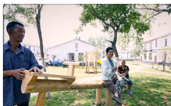
黄花塘游园活动设施