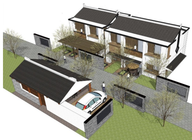
图2：带辅房民居改造前后对比

3. 辅房与主楼相连，成“U”字型院落布局。房屋入口与道路间有一定的空地，可布置屋前绿化及室外停车场地。“U”型院落加设半镂空围墙进行空间分隔，使其更方便每户居民使用。院内采用硬质铺地划分行走和绿化区域，增设院内遮阳设施，有效改善居民居住环境（图3）。