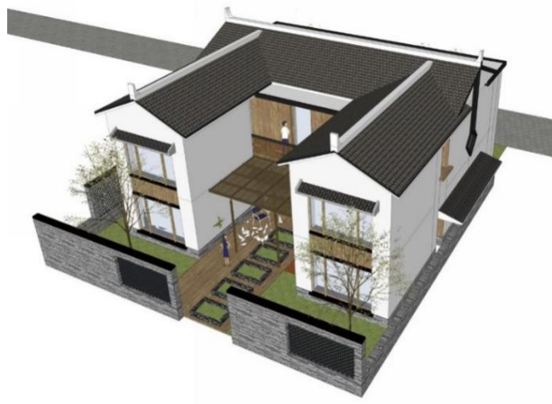
图3: “U”型院落民居改造前后对比

存储空间。我们不能用惯性思维来提出改造导则，而是必须实地调研，了解当地农民的生活习惯和空间使用需求。