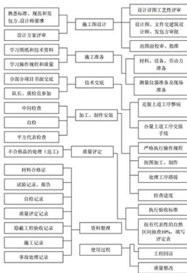
装饰装修——施工管理控制流程图

建筑装饰装修工程设计施工一体化是指以完成建筑装饰为根本目标，根据施工与设计之间的关系，实现对资源、先进技术的科学应用，以此建立完善的设计施工体系，提升设计施工质量与效率。现阶段，设计施工一体化已经成为建筑装饰装修工程的重要发展趋势，国内相关企业对其研究也不断加强，通过应用设计施工一体化系统，能够弥补传统装饰装修设计与施工中存在的不足，加强设计与施工之间的联系，有效提升工作效率，优化工程质量，对提升建筑装饰装修企业的市场竞争力具有重要作用。其主要流程如下图所示：