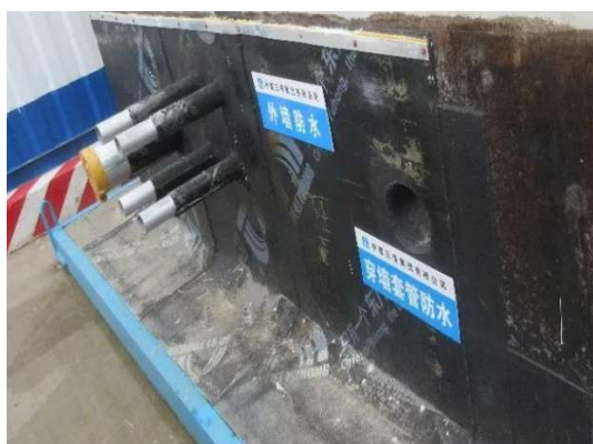
图3 防水做法示意图

有抗渗要求的部位，其对拉螺杆应采用止水螺杆，止水螺杆的止水片应设在混凝土结构的1/2厚度处，且要求焊接饱满密实，必要时可增加止水片的数量，以达到更好的止水效果。施工完毕后外露的螺杆丝头应及时切除，切割面应保证平顺光滑，在外部喷洒沥青油，并涂刷防水涂料或铺设防水卷材，采取必要的刚柔结合处理措施，以加强其抗渗漏性能。