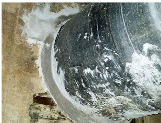
图2 套管安装示意图

若是热力管道穿墙，应在穿墙的位置安装翼环套管，套管上满焊止水环，并在一端的翼环上安装压紧法兰。管道安装完成后，外壁套入耐热橡胶止水套，紧固压紧法兰，套管与墙面接触地方用水不漏封堵。若环境湿度较大、通风条件较差，空气中的水分易冷凝在管道表面，造成“假渗漏现象”，可以通过多通风排除湿气，渗漏现象随即消失。