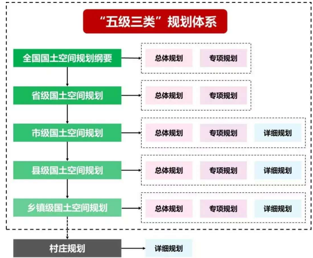
图1 国家国土空间“五级三类”规划体系示意图