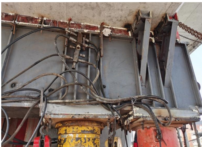
图4 钢管支撑安装完成后

同步性控制主要依靠分配梁及PLC液压同步控制系统来实现，分配梁具有较大的刚度能够将千斤顶提供的顶升力分布于梁底，PLC操作系统可以实现桥梁的同时起落，从而达到需要的顶升效果。千斤顶的力通过分配梁均匀作用于梁底，辅助同步顶升。分配梁与梁体连接主要依靠在梁体侧面及底面植筋然后将钢分配梁与植筋焊接来实现。