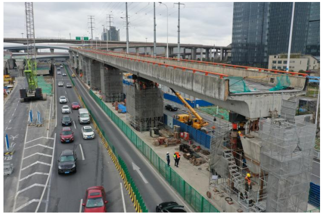
图2 原桥现浇连续箱梁、独柱墩

根据原桥图纸显示，原桥属于独柱墩，上部为现浇混凝土连续箱梁，柱下为承台与桩基础，采用桥梁顶升技术可以确保杨高中路两侧地面道路保持通行且减少混凝土及桥梁拆除。本次顶升利用原承台及桩基础作为顶升反力基础，经过计算及设计单位复核，其基础承台满足受力要求。施工前挖出承台表面，清理表面覆土然后安装钢支撑，钢支撑作为千斤顶下部与承台上部的传力构件，安装时通过在承台顶面钻孔植筋安装。