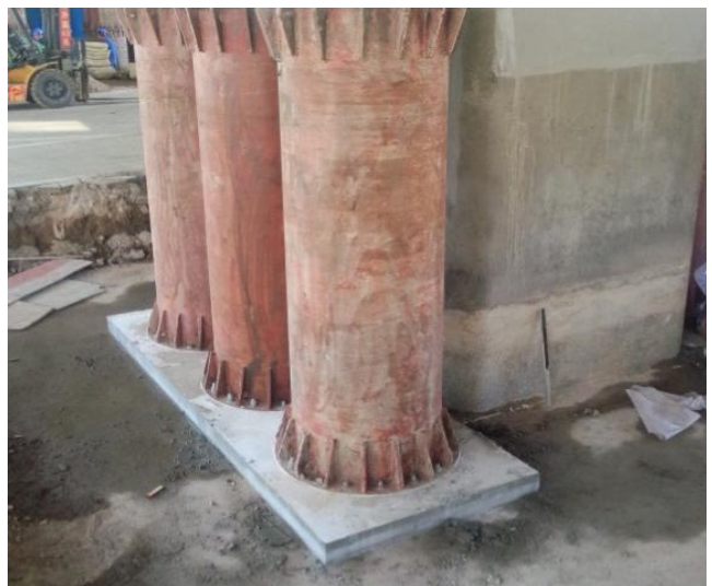
图3 钢管支撑安装完成后

当 \Phi 609 钢支撑与千斤顶之间空间小于1m时，安装 \Phi 609 工具式垫块，随着顶升高度的增加，再更换为 \Phi 609 钢支撑。为了维持顶升过程中的支撑稳定须对支撑进行槽钢加固，所选用的槽钢为14a型，将槽钢与支撑进行焊接行成整体式格构增加支撑的稳定性，同时将槽钢与下部立柱进行拉结。以上钢支撑亦可作为后续分配梁安装时的临时支撑，待分配梁焊接与灌浆完成后将多余部分拆除留出空间安装千斤顶。