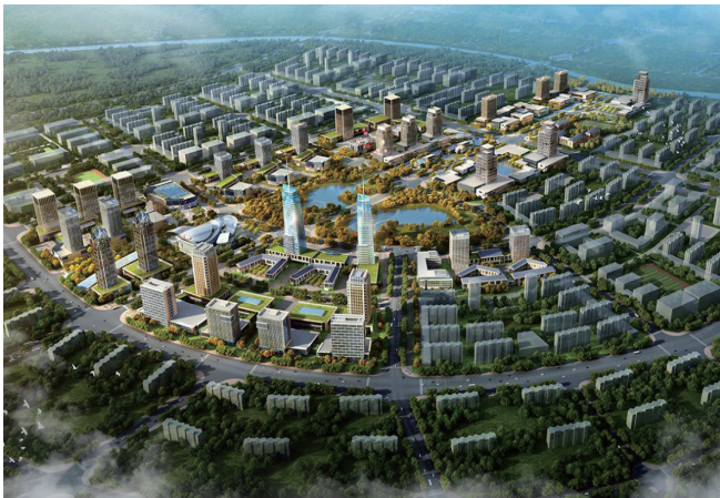
图2 新型城镇化建设构想局部示意图

我国县城数量众多，既有地域性特征，又在经济发展中有不同的限制性条件。为此，县城新型城镇建设要综合考虑发展基础、人口、地理位置等因素，在明确自身发展的优势和短板的前提下，以创新驱动为发展理念，统筹生产、生活等因素，以产业结构、国土空间资源等为具体工作的落脚点，满足产业土地资源节约开发利用与保护要求，与城乡一体化发展进程衔接。如下图2所示，为新型城镇化建设构想局部示意图。