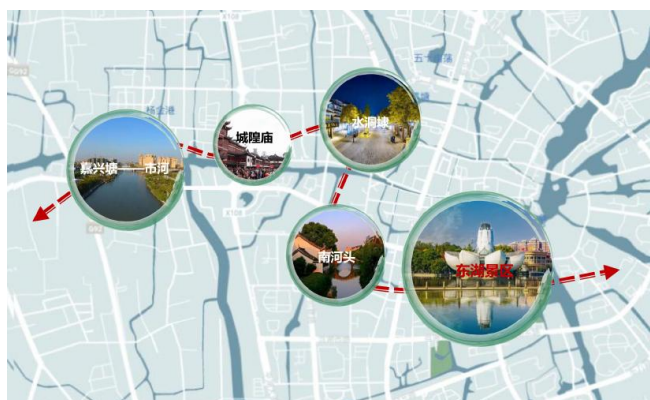
图2 平湖市域文化旅游带 (二) 老城容量与建设规模需求

本项目容积率要求大于1.3，若将老城布局单纯复制，容积率仅为0.5-0.6。传统古城的开发多以小街小巷小业态的思路为主，开发容积率较低，若将老城布局简单复制，无法满足项目容量要求。如何通过空间布局的创新，在满足建设量的前提下，避免对老区形成压迫感，实现新、老尺度及容量的和谐共生，形成有特色、有活力的街区氛围？