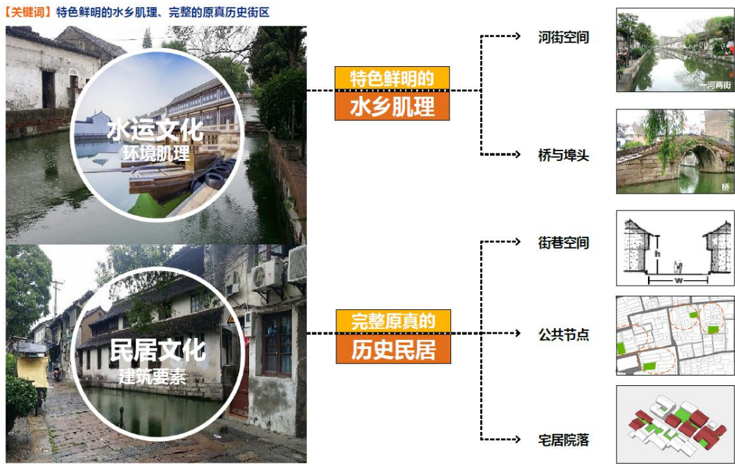
图4 老城肌理及文化要素提取