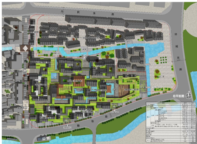
图1 总平面图

本项目位于已建成南河头历史文化街区一期南侧，勤俭路北侧，环城东路西侧，建国南路东侧，与南混堂弄省级历史文化街区隔河相望，南河头省级历史文化街区一路相隔。整个地块为纯新建地块，用地范围内无保护建筑和保留建筑，现状房屋征收与拆除工作已完成。