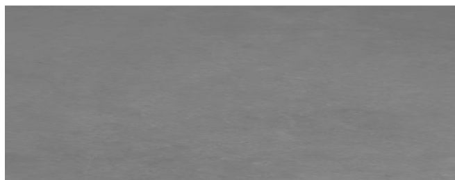
预应力箱梁侧面混凝土质量

(七) 通过现场预留同条件混凝土试件检测7d混凝土强度达到C50标号的95%以上，现场侧模拆除后，对外观质量进行了一次检查，结果没有发现梁体混凝土出现裂缝，箱梁侧面混凝土表面色泽均匀一致，达到了预期较好的效果。